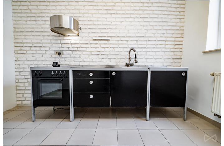
Le mobilier repris sur les photos ne fait pas partie de la vente conformément à l'article 3.9 du nouveau code civil.