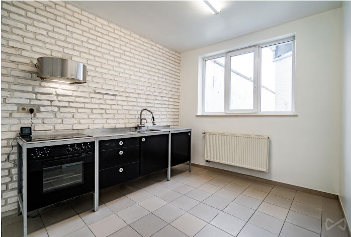
Le mobilier repris sur les photos ne fait pas partie de la vente conformément à l'article 3.9 du nouveau code civil.