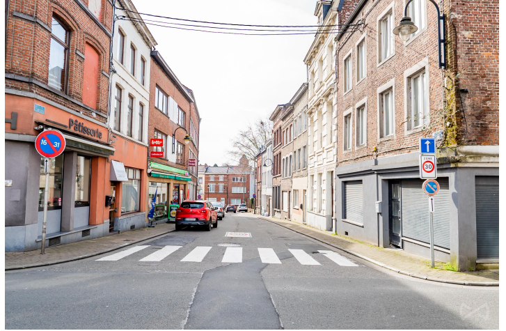
Le mobilier repris sur les photos ne fait pas partie de la vente conformément à l'article 3.9 du nouveau code civil.